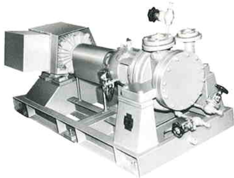
ECONOMY TYPE SMK 2 STAGES MODEL